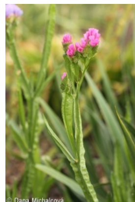
Informace k mapě