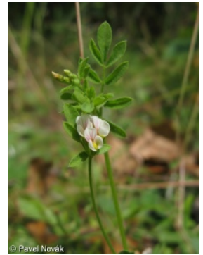
Informace k mapě