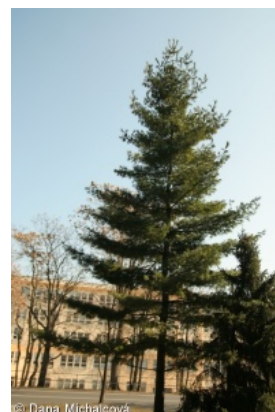
Informace k mapě