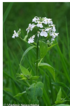
Informace k mapě